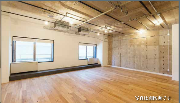
写真は別区画です。