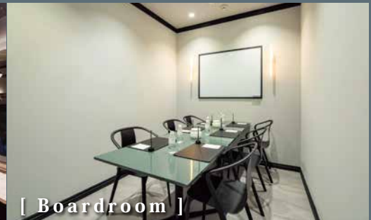
[ Boardroom ]