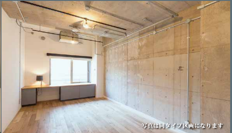
写真は同タイプ区画になります