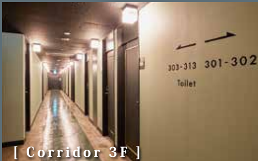
[ Corridor 3F ]