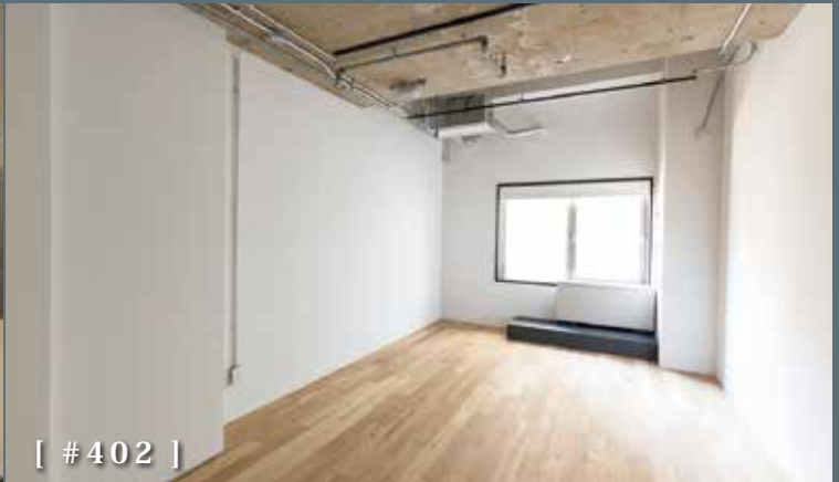
[ #402 ]