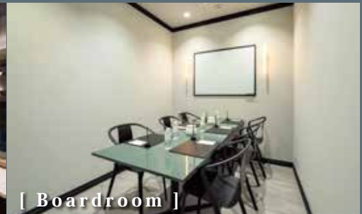
[ Boardroom ]