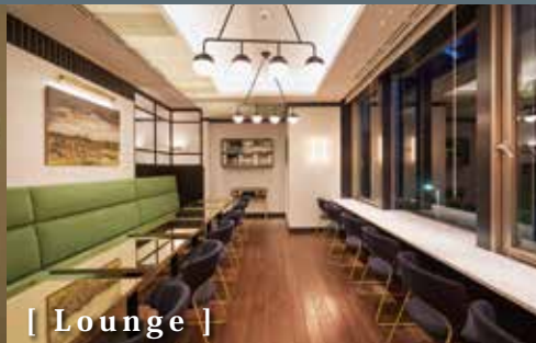
[ Lounge ]