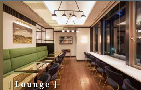
[ Lounge ]