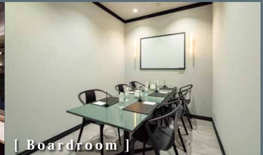
[ Boardroom ]