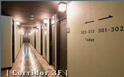
[ Corridor 3F ]