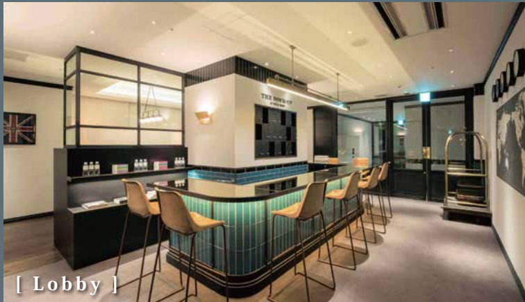
[ Lobby ]