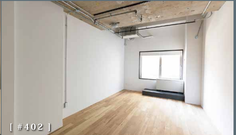
[ #402 ]