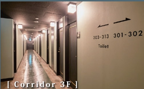
[ Corridor 3F ]