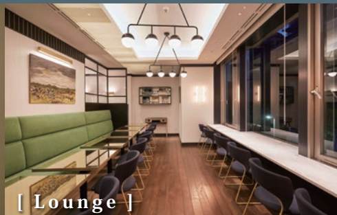
[ Lounge ]