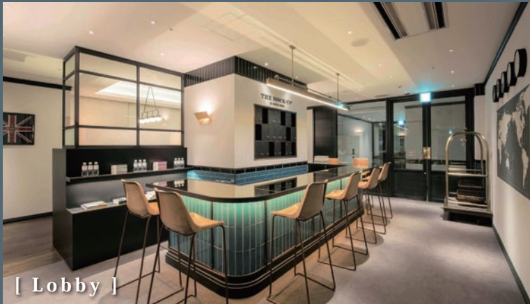
[ Lobby ]