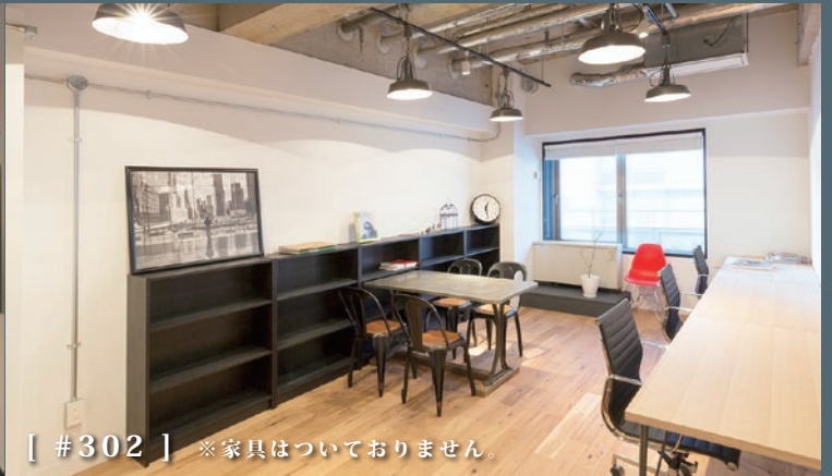
[ #302 ] ※家具はついておりません。