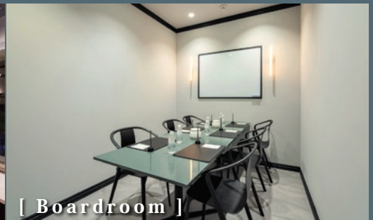
[ Boardroom ]